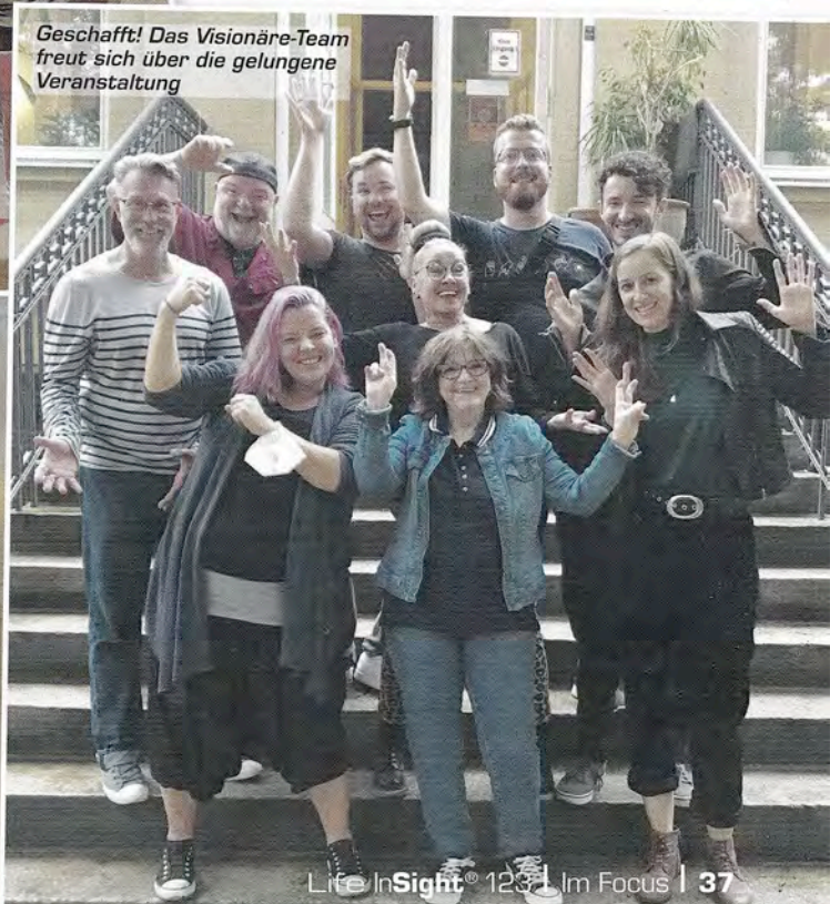
Geschafft! Das Visionäre-Team freut sich über die gelungene Veranstaltung