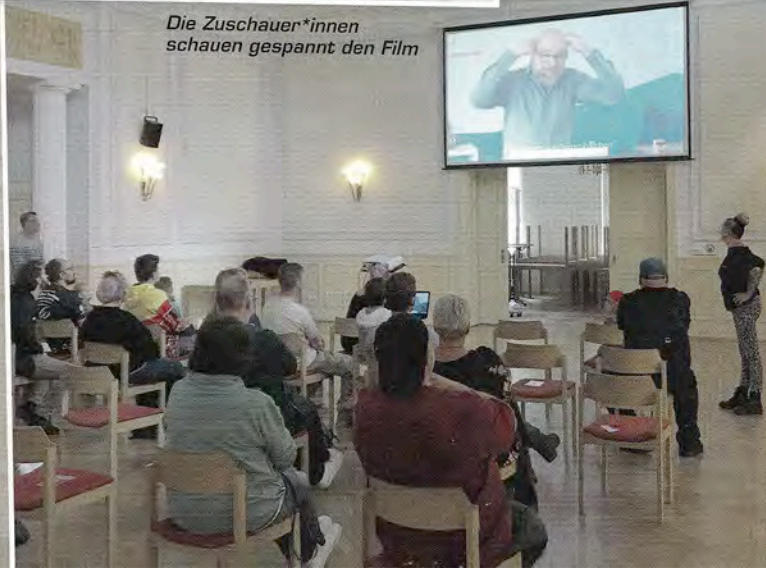
Die Zuschauer*innen schauen gespannt den Film