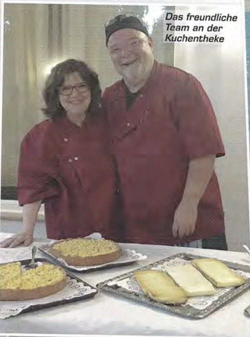
Das freundliche Team an der Kuchentheke

Senden Sie uns bis zum 10. Oktober 2021 eine E-Mail mit dem Kennwort: „Kinder an die Macht“ plus Ihrer Kundennummer an: info@life-insight.de