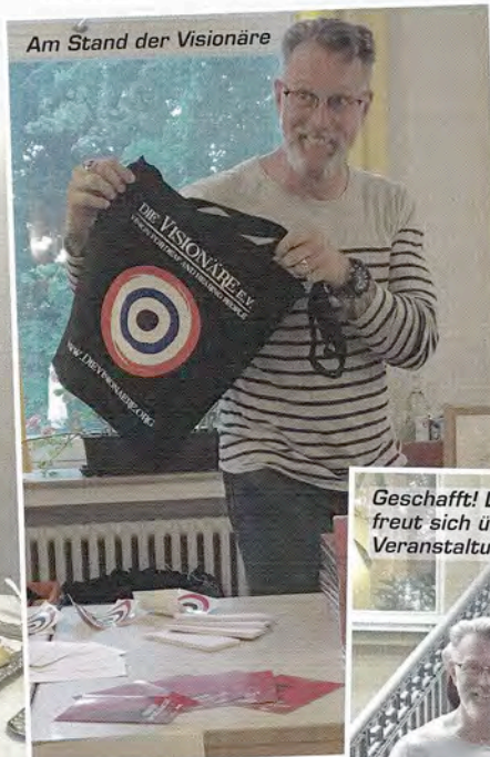
Am Stand der Visionäre